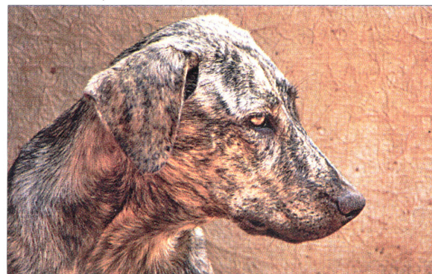
Este joven ejemplar de 'ca d'ajuda virat' tiene una espectacular belleza.

cuando en otras razas hay distintos colores. Hemos encontrado un cuadro pintado en el siglo XVI en el que aparece el señor de una possessió de Palma (Son Flor) en el que se ven las casas a su espalda, el senyor y un perro d'ajuda virat . También de este siglo hay otros documentos que hablan de los bandejats que usaban