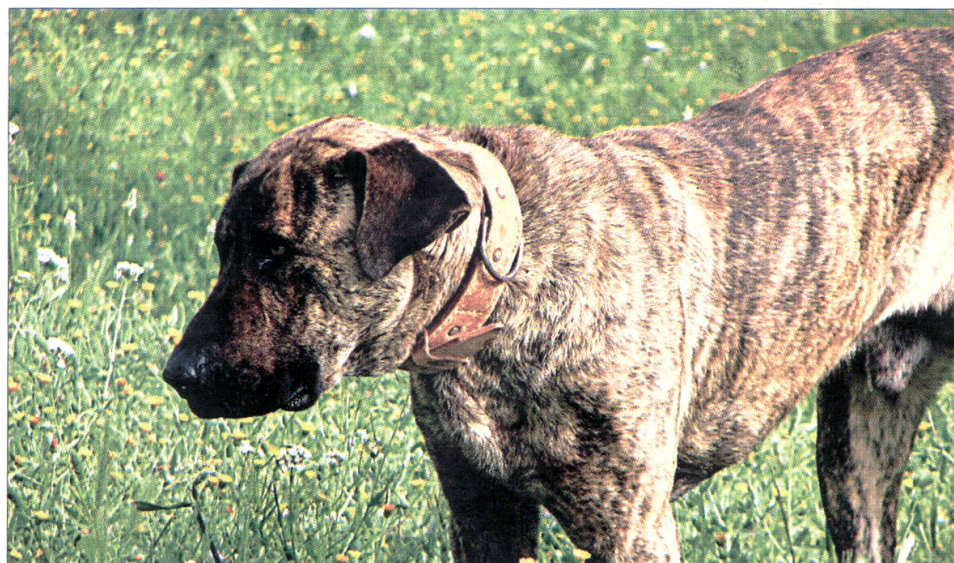
En las dos fotos se ve a la perfección que el 'ca virat' de la izquierda y el pastor mallorquín negro (derecha) tienen las mismas características físicas.